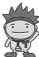
香川県がん征圧イメージキャラクター 「ソウキくん」