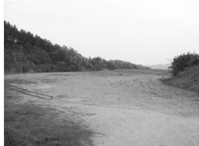
田万ダム土捨て場

「羽床小学校大規模改修工事」、「綾上・綾南水道連結管整備事業」など6カ所について、いずれの工事も適正に改修・施工されていることを認めました。杣所地区「田万ダム土捨て場施設」については、民間等への売却が早期にできるような積極的な推進をお願いします。