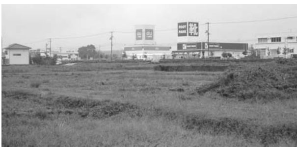
草刈りの終わったコーナン商事建設予定地

答 老朽化している低区配水池を計画していたが、改修に180トンの仮設タンクが必要で、高額となり、近くに仮設用地もないため改修は中止した。中区配水池を近くに移転拡張する計画に変更しました。