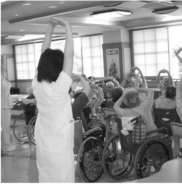
サンビューちばの研修風景

近年、全国的に超高齢社会といわれ、綾川町でも高齢化率が上昇し、約27%に達しています。必然的に医療や看護、介護の需要も高まってくる