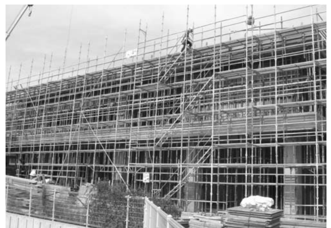
建設中の老健施設

問 返還されない場合は、 旧綾南町の人が受診 していたが、返還できな いからといって、逃げ得 は許せないものであり、 強制執行します。