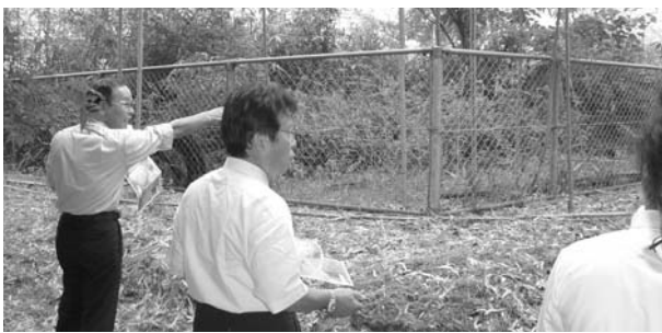
中区配水池の移転予定地

答 コーナン商事(株)の店計画のところでは、計画予定地を、町道で分割しないと商業施設の床面積が1万㎡以下にならず、開発要件に該当しなくなる。登記費用、施行同意の手続き、町道の工事費など、全て同社から負担金も入り、町道認定を受