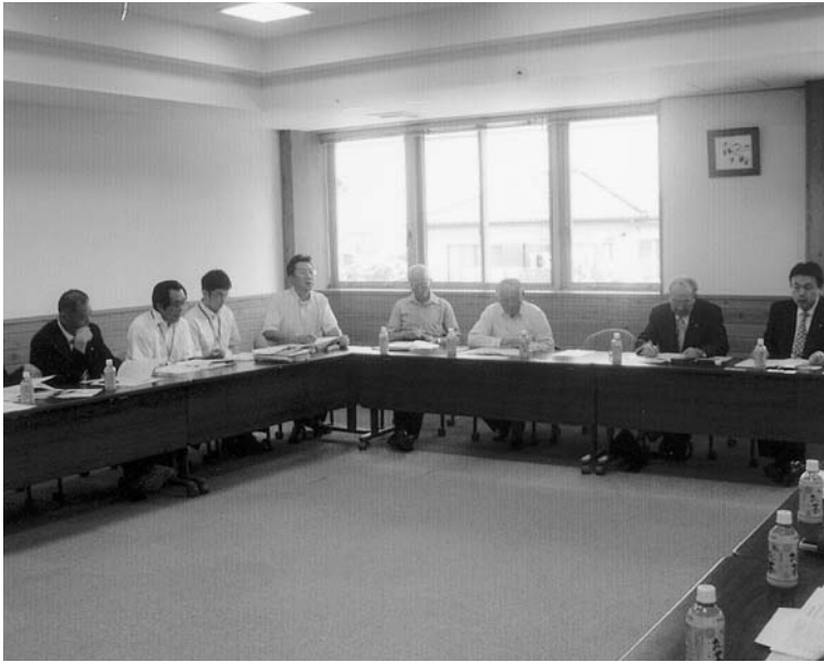
宮代町の研修風景