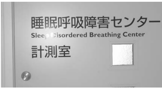
オープンした睡眠呼吸障害センター

「自宅葬から斎場葬への移行」が進む中で、葬祭業者の料金体系・運営などの実態把握に努めることは、住民ニーズを把握する上で必要である。したがって、高松市の事例も参考に調査したい。