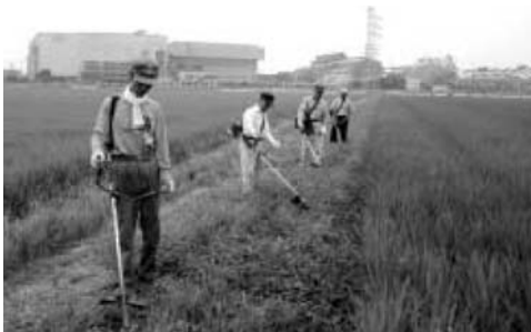
農業委員による雑草刈払い（久喜市）

農業委員会は優良農地の保全、農業経営の安定化を図る農地の番人としての役割を果たさなければなりません。そのために農地の違反転用の防止や遊休農地対策のため、年2回農地パトロールの実施により、農地を預ける行政機関としての機能を発揮しています。久喜市は、昭和57年に