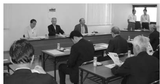
久喜市の研修風景

しかし、相続による農地の分散や不在農地所有者など問題も多く、農業委員会を中心に「農地1年1作」を農業者に呼びかけて、不耕作地発生の防止に努めています。