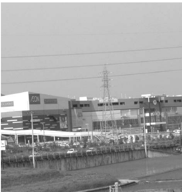
イオン綾川ショッピングセンター