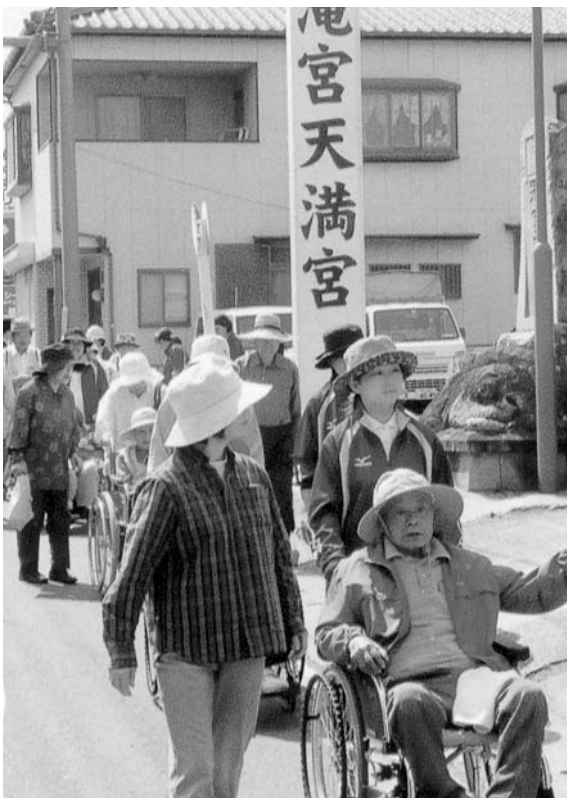
楽々苑利用者のご家族と職員らによるハイキング

理者制度が設けられた。合併後の行政需要は多様化し、加えて大型事業の推進が課題であり、組織強化が求められることから、今後とも参事制度は継続します。