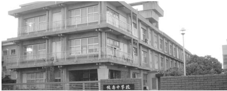
改築予定の綾南中学校

習センターの建設についてはその必要性は認め、今後とも議会と協議しながら進めていくこととなりました。