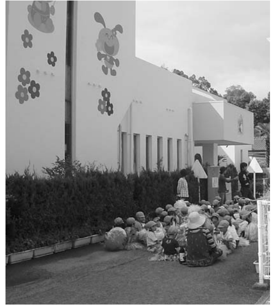
一時保育を実施している滝宮保育所