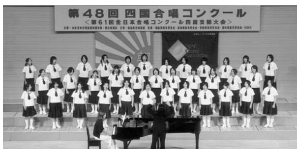
全国大会での綾南中学校合唱部

中学校の各クラブ活動の活動が活発で、その成績も優秀により、全国大会等に参加しました。