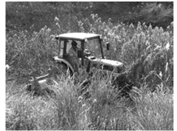
（モアテイラーによる雑草刈り）