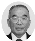
山口 守 山田上