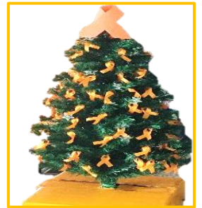
綾川町役場正面玄関にあるオレンジリボンツリー