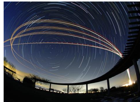
【高山航空園の夜の景色】

また、「讃岐うどん発祥の地」とも知られ、観光客でにぎわう名店が揃い、米やそば、いちご、柿、ぶどう等の農作物の生産が盛んです。