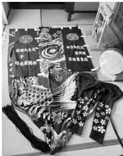
【大原団子出自治会】

令和3年度一般コミュニティ助成事業（一般財団法人自治総合センター）を活用して、コミュニティ活動用の備品整備を行いました。今回、事業が完了したのは陶地区の大原団子出自治会と羽床地区の脇・大坪・川下中自治会です。お祭りなどで使用する獅子舞用の獅子頭・油単・鉦・太鼓などを購入しました。今回の購入をきっかけに、今まで以上に地域の団結力が向上し、地域コミュニティの活性化が期待できます。