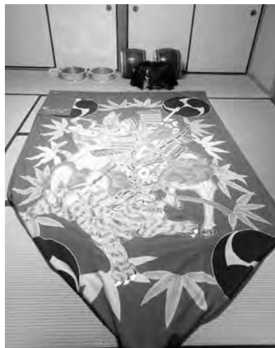
【脇・大坪・川下中自治会】