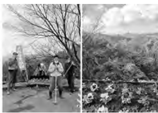
皆さんの協力のおかげ様