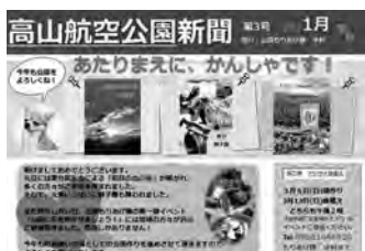
配布している「高山航空公園新聞」

「遊歩道に花を咲かせよう！」のイベントを行います。皆さんから頂いたアジサイの株を植えていただき、花咲く梅雨を待ちたいと思います。ぜひ、ご参加ください。