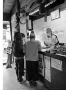
楽しそうに利用する若者

今はソロキャンプで、あえて仕事や家庭での立場から離れるために一人の時間を確保している。自然の中での解放感は気持ち良い。8年間利用しているが、ここは居心地が良く、好きな場所です。」