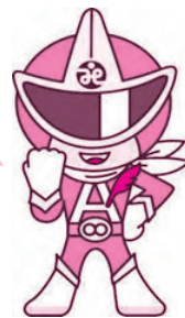
つながるんジャー