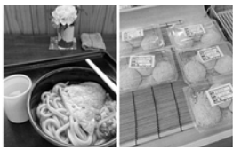
もち麦うどんときな粉おはぎ