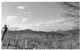
パークセンター西斜面からの山なみ

公園ボランティアグループ(もりあげ隊)が今年もパンジーピオアをはじめ各種の花を育てています。また、パークセンター西斜面の木が切られ見晴らしがよくなりました。高山航空公園をこれからもよろしくお願ひします。