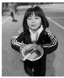
差入れのお味噌汁で温まりました！

〈開催概要〉 日時：令和4年12月4日(日) 午後6時～8時 会場：綾川町ふれあい運動公園 人工芝グラウンド 主催：綾川町、UDN香川FC、リーグベスト 協力：ベースロ、香川県、(公財)香川県国際交流協会 参加者：計38名