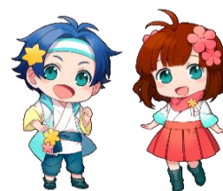
綾川町子育てイメージキャラクター かんちゃん あゆちゃん