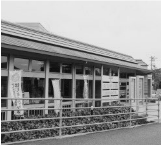
収納が可能となる郵便局など

固定資産税の前納報奨金について、第1期の納期限までに年税額を全て納付した場合に、前納報