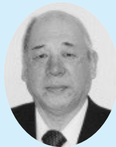
碓石 真己 議員