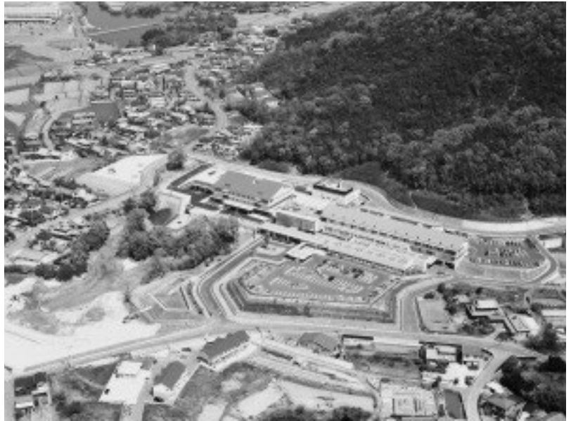
陶病院・介護老人保健施設あやがわ

問 介護保険制度の改正はどのような計画か。 答 第6期介護保健事業計画を策定するもので、要支援の一部サービスを自治体へ移行する等の国の方針等が示される中で、計画を策定していく。