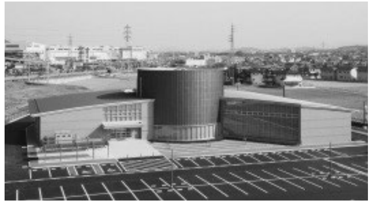
綾川町生涯学習センター