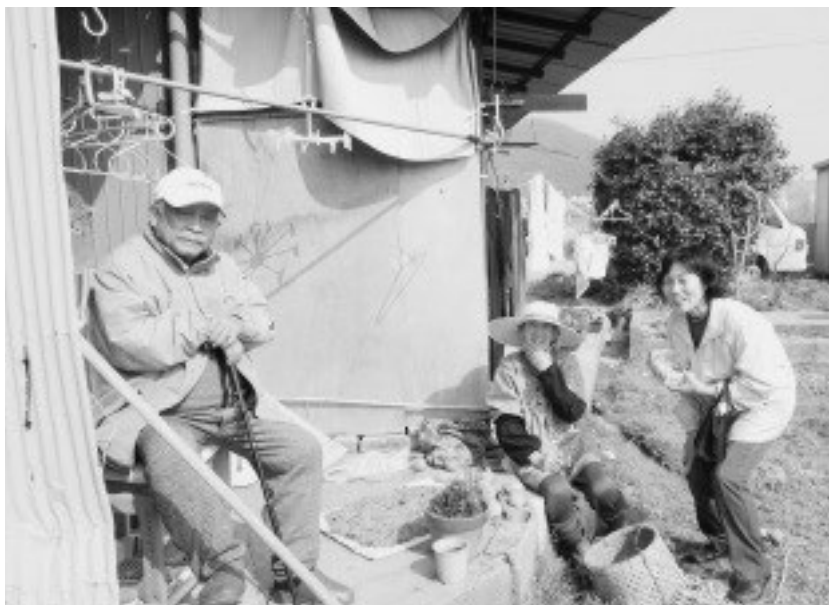
まちかどほっと飲事業 モデル事業の様子