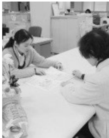
地域包括支援センター

答 平成27年度からの介護保険制度の見直しによる要支援者の介護サービス事業が町事業に移行される見通しであり、業務の増加が想定される。