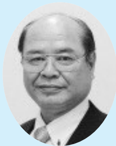
河野 雅廣 議長