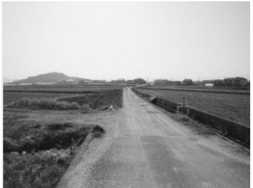
町道茶円原線 (畑田)

問 農地集積専門委員の人選は。 答 県段階に設置される農地管理機構が人選、雇用して町へ配置する。1名程度の配置が予定されている。 問 アスバラガス「さぬきのめざめ」を、部会に加入していない一般の農家から、希望があれば栽培できるのか。 答 「さぬきのめざめ」の栽培については、県が開発した独自の品種であり、産地を守るためにも門外不出である。一般農家への株分けなどは、一切できないことになっている。 問 年間150万円の支援を行っている青年就農給付金の内容は。 答 45歳未満の新規就農者が、経営開始の経営が不安定な最長5年間に、所得が250万円に満たない場合、国から年間150万円が給付されるものである。ただし、所得が250万円を超えるとその時点で給付が停止する。