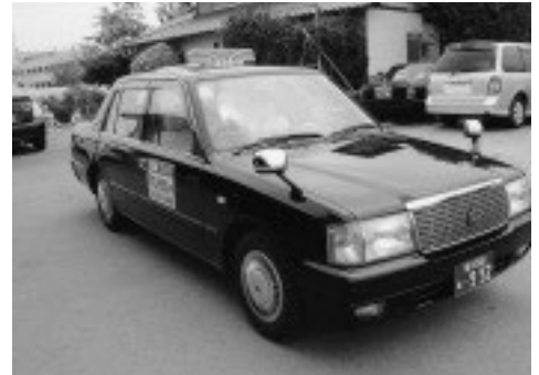
デマンドタクシー