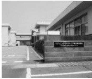
パナソニックライティング香川

町でも5歳児検診を取り入れることの考えは。教育長 5歳児検診の実施については、専門の知識を持った医師、臨床心理士、保健師、保育士、栄養士等の確保が必要である。また、発達障害と診断された場合の診断後のフォローアップ体制も非常に重要であり、今後の検討課題とする。