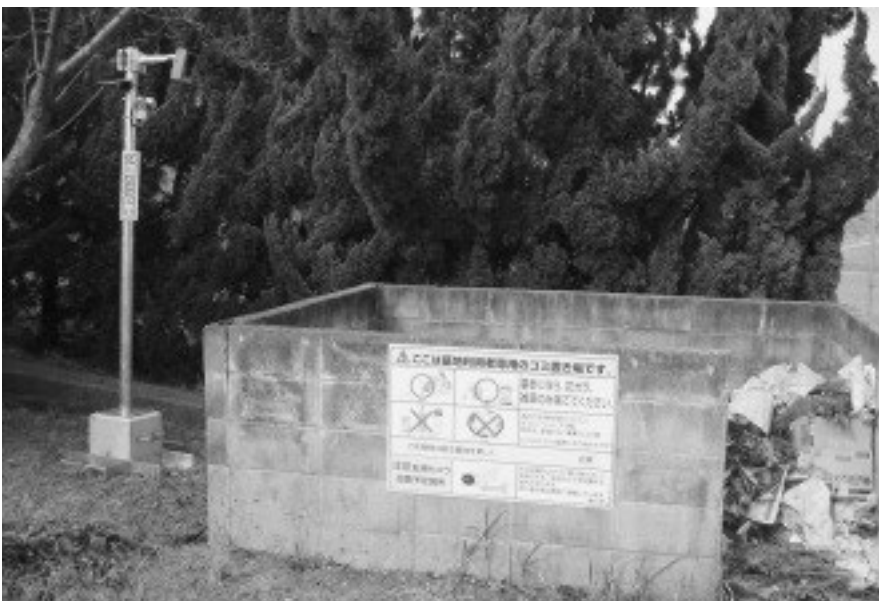
監視カメラの設置 (くらかけ公園ゴミステーション)