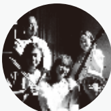
きまいちゃんバンド