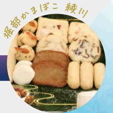
堀部かまぼこ 綾川