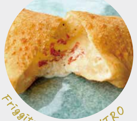
Friggitoria AL CENTRO