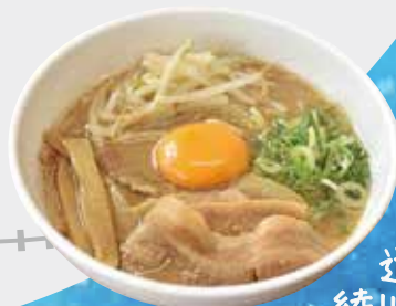
道の駅滝宮・綾川町うどん会館 ショップ綾川

飲酒運転はされないように、アルコールを飲まれる方は公共交通機関にてお越しください。イベントの駐車場はございません。