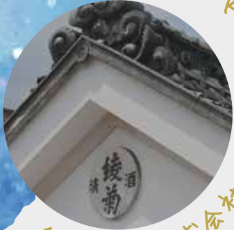
綾菊酒造株式会社